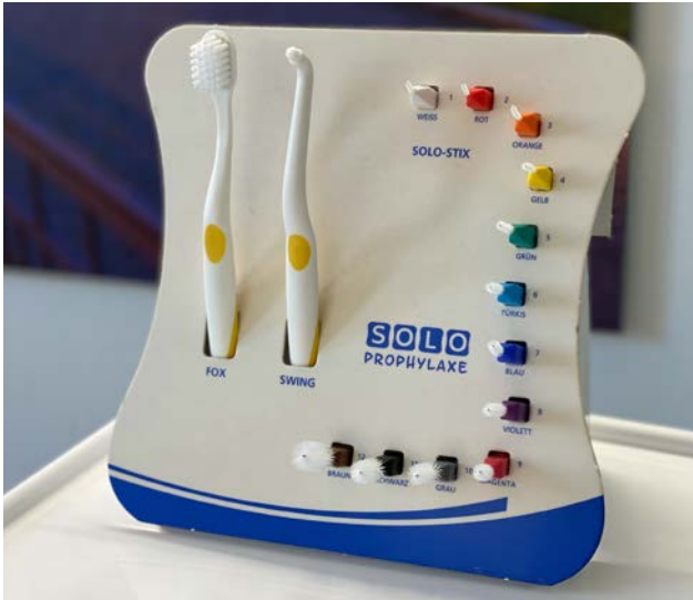
Abb. 3: Das SOLO-Prophylaxe-Sortiment.