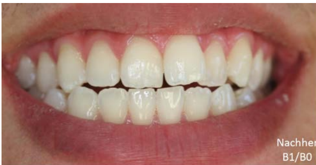
Abb. 5: Bleachingergebnis mit Natural+