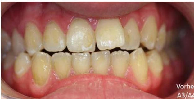
Abb. 4: Ausgangssituation vor dem Bleaching