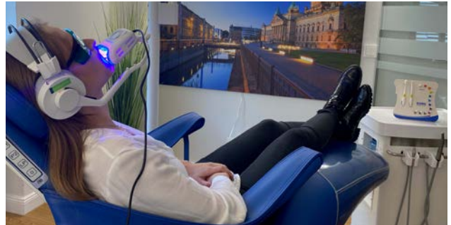
Abb. 6: Symbiose von Prophylaxe und Bleaching.

Das 33-prozentige Wasserstoffperoxidv Gel von NATURAL+ ist frei von Schwermetallen und 100 Prozent ökologisch. Schwermetalle verbinden sich mit den Mineralien auf der Zahnoberfläche und verursachen einen Wasserverlust durch Diffusion, was zur Austrocknung der Zähne führt. Bei der Zahnaufhellung mit NATURAL+ wird eine optimale Hydratation der Zähne während des gesamten Bleachingprozesses gewährleistet. Dank der speziellen patentierten Formel erfolgt die Zahnaufhellung pH neutral und unter Zufuhr von einer hohen Konzentration von Mineralien wie